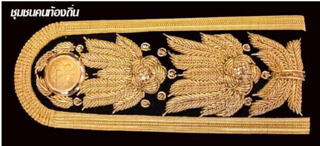
พนักงานองค์กรปกครองส่วนท้องถิ่น ตำแหน่งระดับ ๗-๘

- มีแถบสีทองกว้าง ๕ เซนติเมตรเป็นขอบและปิดด้วยสีทองลายช่อชัยพฤกษ์ยาว ตลอดส่วนกลางของอินทรรณู