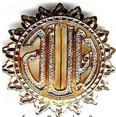
องค์การบริหารส่วนตำบล