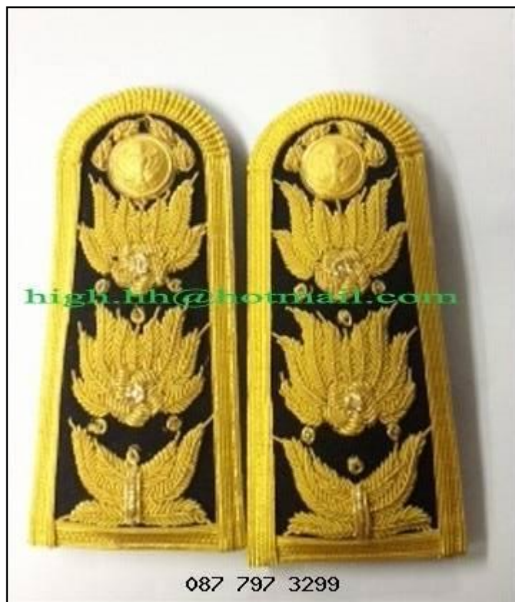
พนักงานองค์กรปกครองส่วนท้องถิ่น ตำแหน่งระดับ ๙ ขึ้นไป

- มีแถบสีทองกว้าง ๕ เซนติเมตรเป็นขอบและปิดด้วยสีทองลายช่อชัยพฤกษ์ยาว ตลอดส่วนกลางของอินทรรณู